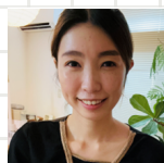
R.Yさん 東京都・30代 サロンオーナー セラピスト歴17年

受講して本当に良かったです! 深部リンパ節開放は、体の内側から整える“リンパの新常識”。まだ知られていないからこそ、学ぶ価値があります!